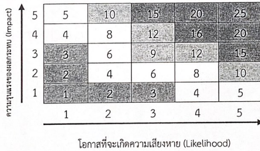
ตารางระดับความเสี่ยง (Degree of Risk)